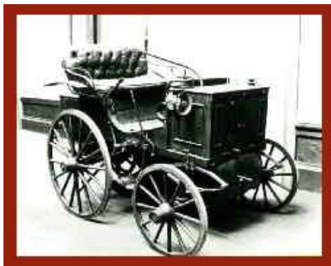
Automobile Panhard&Levassor 1891

« LEVASSOR conçut la première automobile homogène réellement digne de ce nom et de ce qualificatif » (en effet, il ne fallait pas confondre voitures automobiles et tricycles ou quadricycles à moteurs, véhicules intéressants certes mais qui relèvent des techniques vélocipédiques).