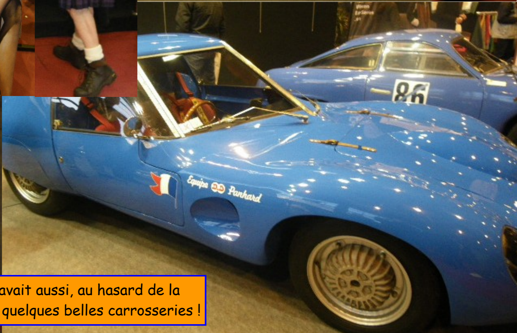
Il y avait aussi, au hasard de la balade, quelques belles carrosseries !