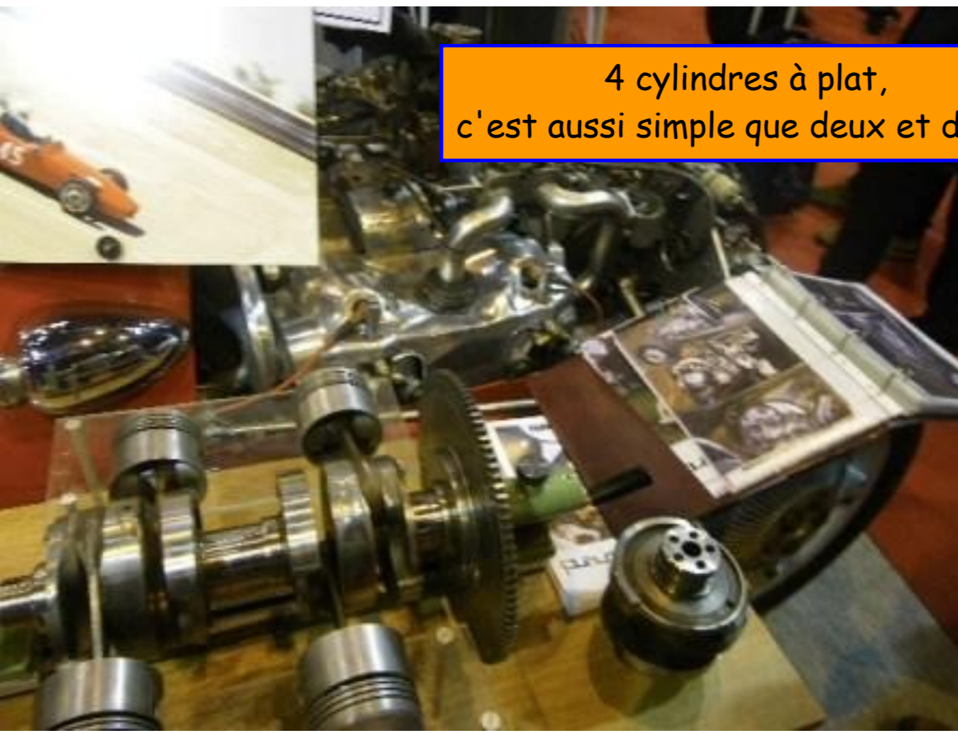
4 cylindres à plat, c'est aussi simple que deux et deux !