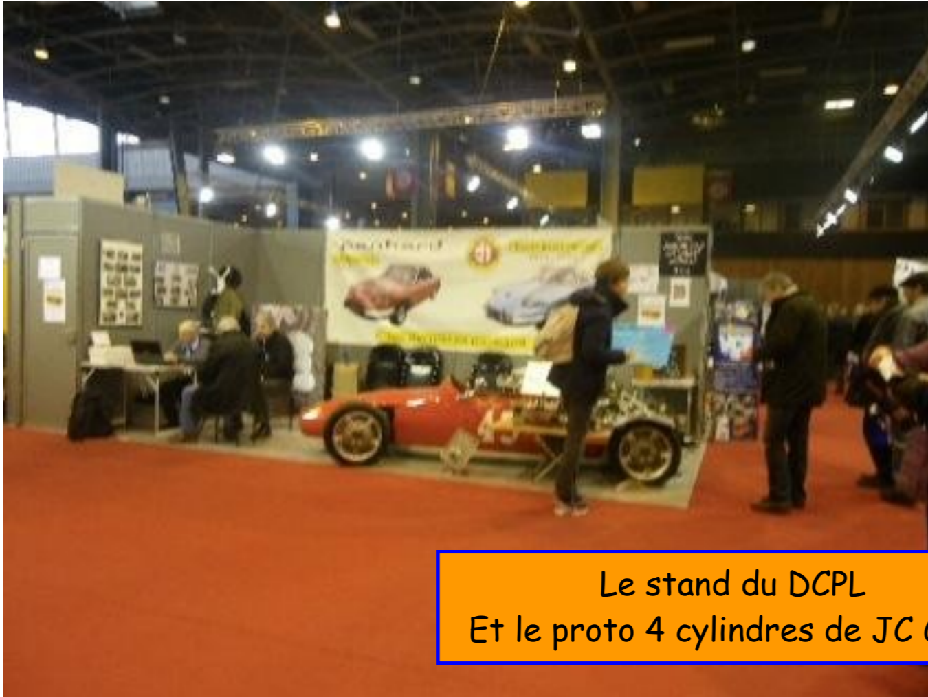
Le stand du DCPL Et le proto 4 cylindres de JC Guny