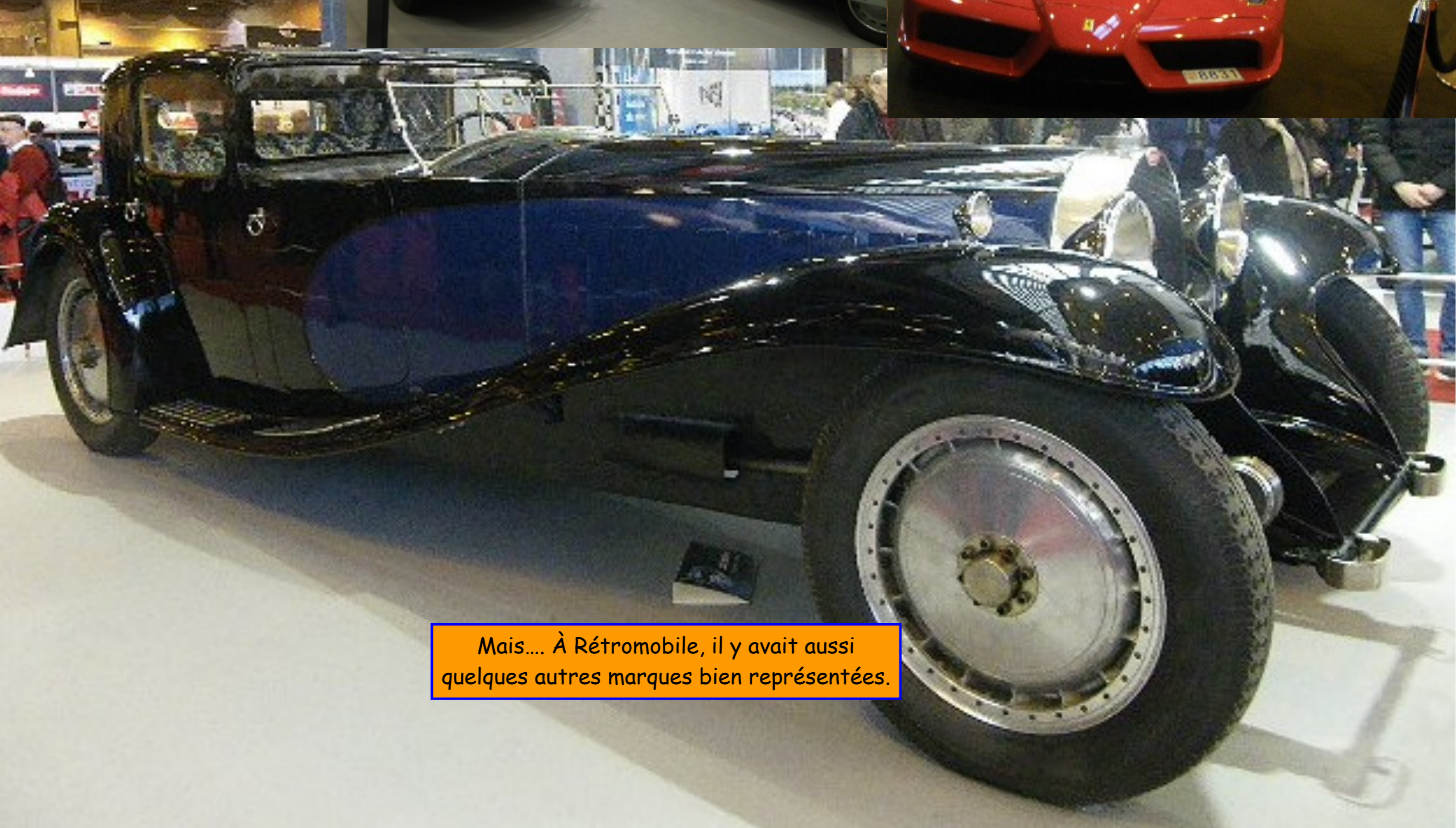
Mais... À Rétromobile, il y avait aussi quelques autres marques bien représentées.